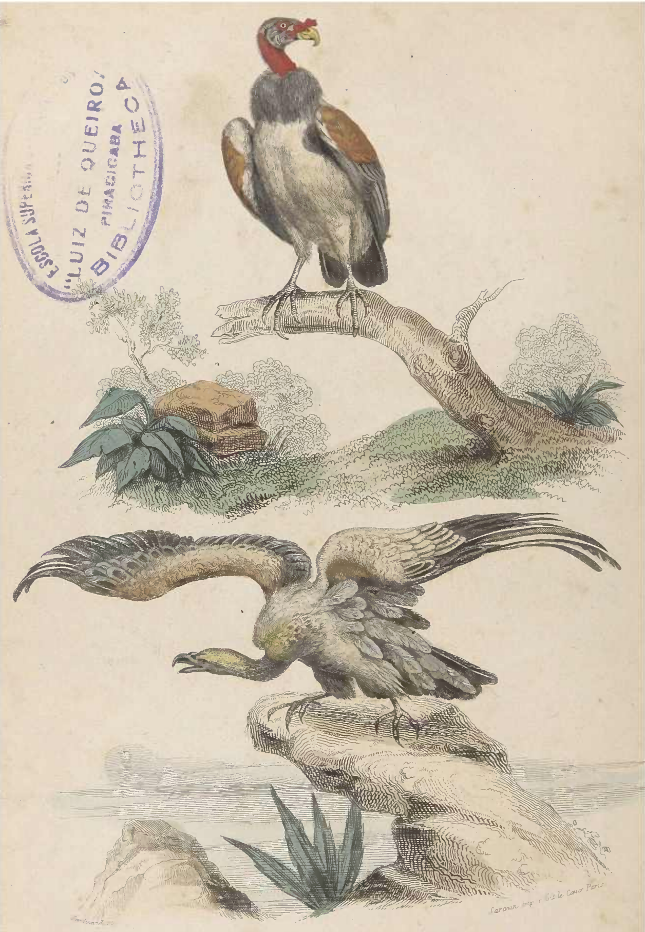
Le Vautour Royal. Le Vautour fauve.