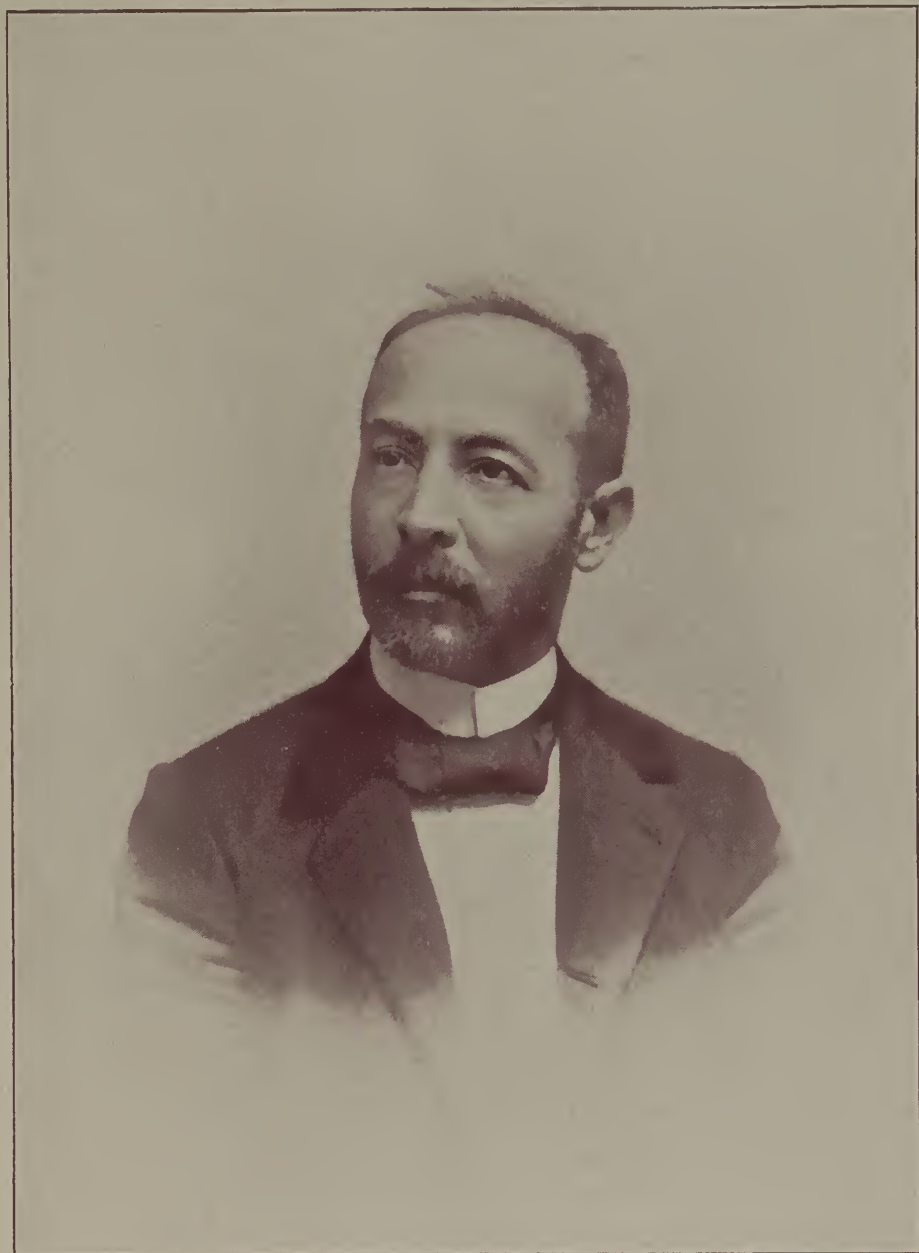
Dr. JOAQUIM MURTINHO